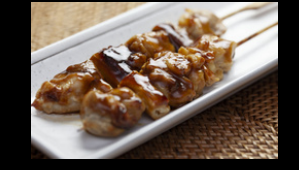
2 Stück Hähnchenspieße in Yakitori-Sauce f