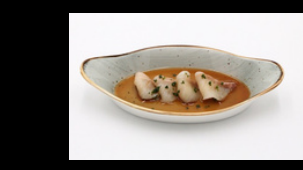
4 Stück d Gelbschwanzmakrele d Sashimi in Punzo-Sauce f