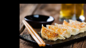
5 Stück Hähnchen Gyoza