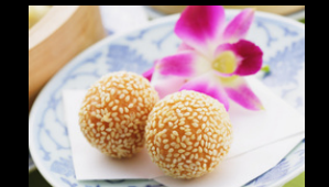
2 Stück Sesambällchen