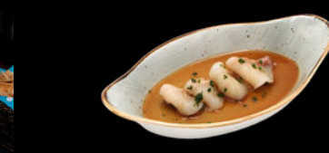
4 Stück Dorade d Sashimi in Trüffel-Sauce f