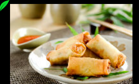
5 Stück Mini vegetarische Frühlingsröllchen a,c