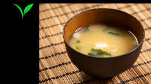
Miso Suppe mit Tofu f , Seetang und Lauchzwiebeln