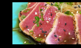
4 Stück leicht angebratener Thunfisch d in Miso-Sauce f