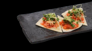
3 Stück Lachstatar auf Fladenbrot a,c (Mit Thunfisch +1 €)