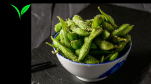
Junge Sojabohnen f mit Meersalz